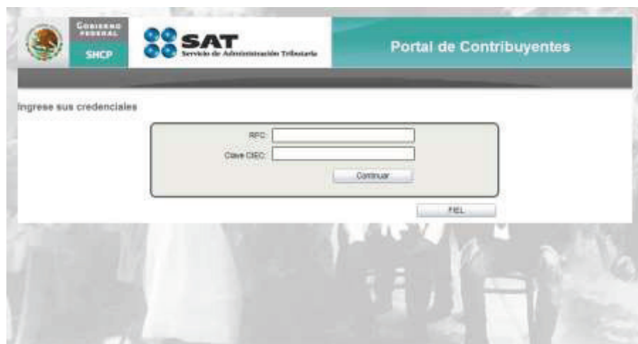
Imagen 1 Pantalla de Autenticación CIEC

La primer opción para poder autenticarse al portal es mediante las credenciales CIEC para lo cual el usuario debe ingresar el RFC y Clave CIEC en la pantalla de captura, para después seleccionar el botón “Continuar”. Si los datos fueron correctos se permite el acceso al portal.