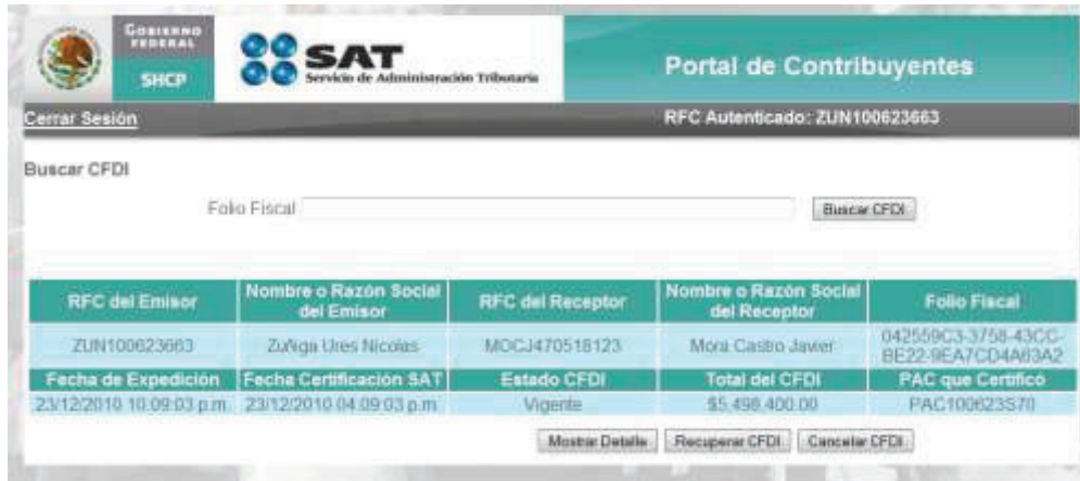
Imagen 3 Pantalla de resultados de la búsqueda

Posterior a la Consulta el usuario puede ejecutar las siguientes funcionalidades: Mostrar detalle, Recuperar CFDI o Cancelar CFDI (Recuperar acuse de cancelación en caso de que el CFDI esté previamente cancelado).