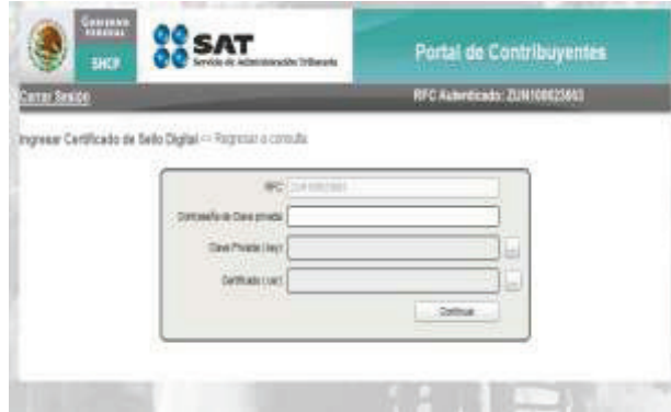
Imagen 6 Pantalla de captura del certificado de sello digital.