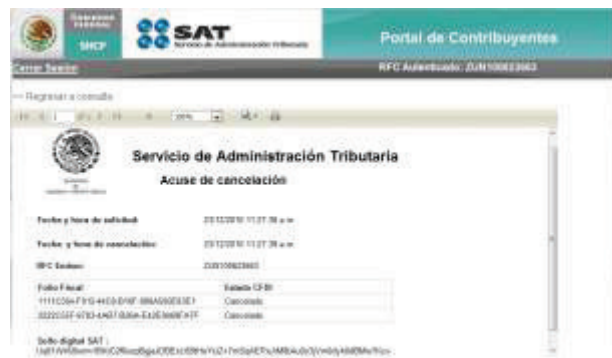
Imagen 7 Ejemplo de un acuse de cancelación.