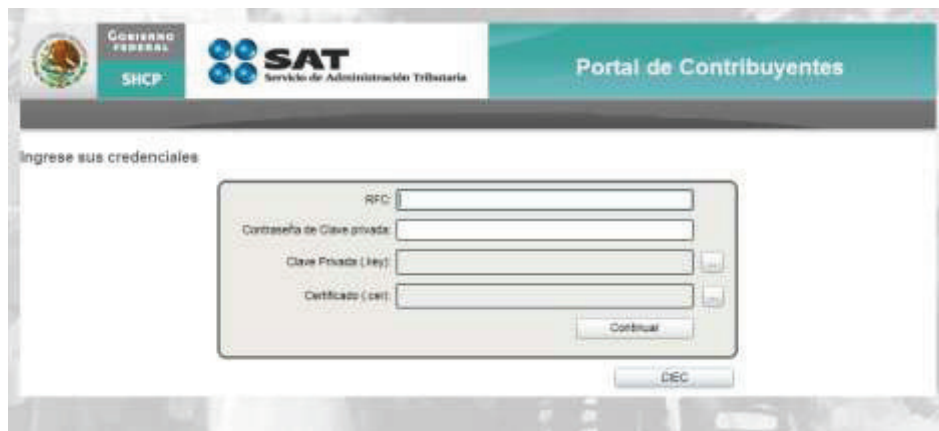
Imagen 2 Pantalla de Autenticación FIEL

Para poder autenticarse el usuario debe ingresar el nombre de usuario, contraseña de clave privada, llave privada (*.key) y certificado (*.cer).