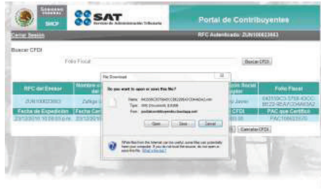
Imagen 5 Pantalla “Recuperar CFDI”.

El nombre del archivo que está siendo recuperado corresponde con el folio fiscal (sin guiones).